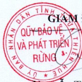
Nguyễn Tất Tùng